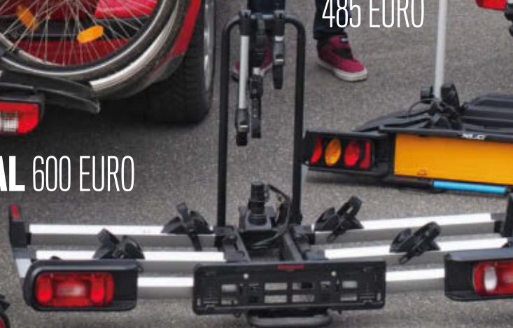
XLC 485 EURO

Fahrräder werden am besten auf einem Kupplungsträger transportiert – der große Test