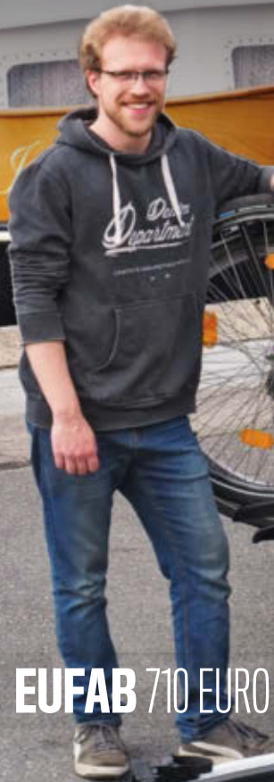
EUFAB 710 EURO