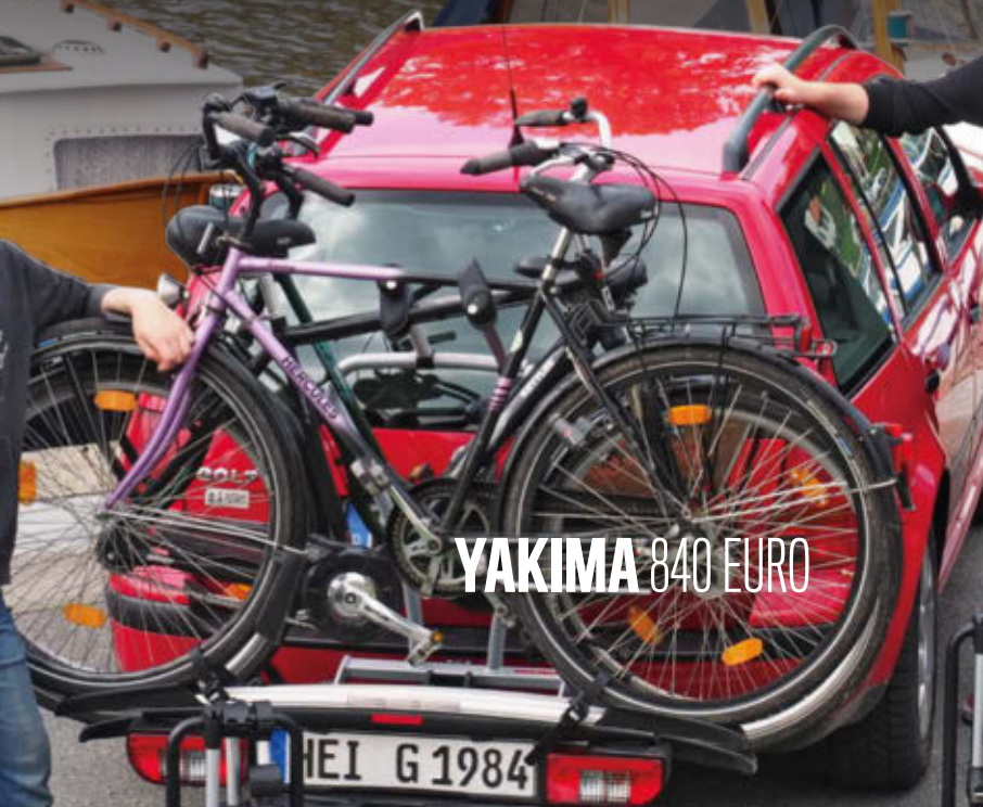
YAKIMA 840 EURO