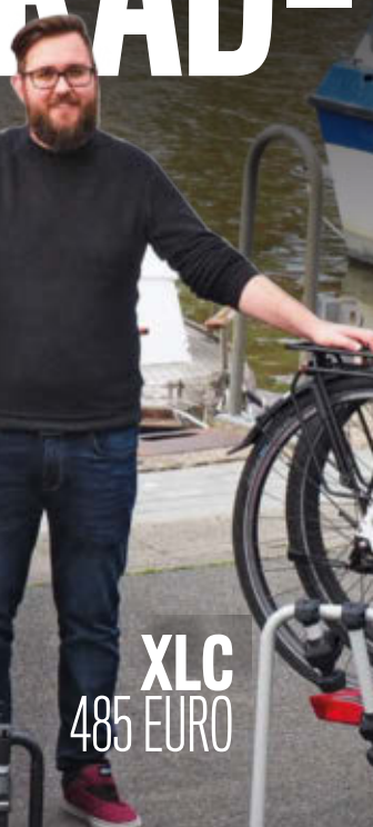
XLC 485 EURO